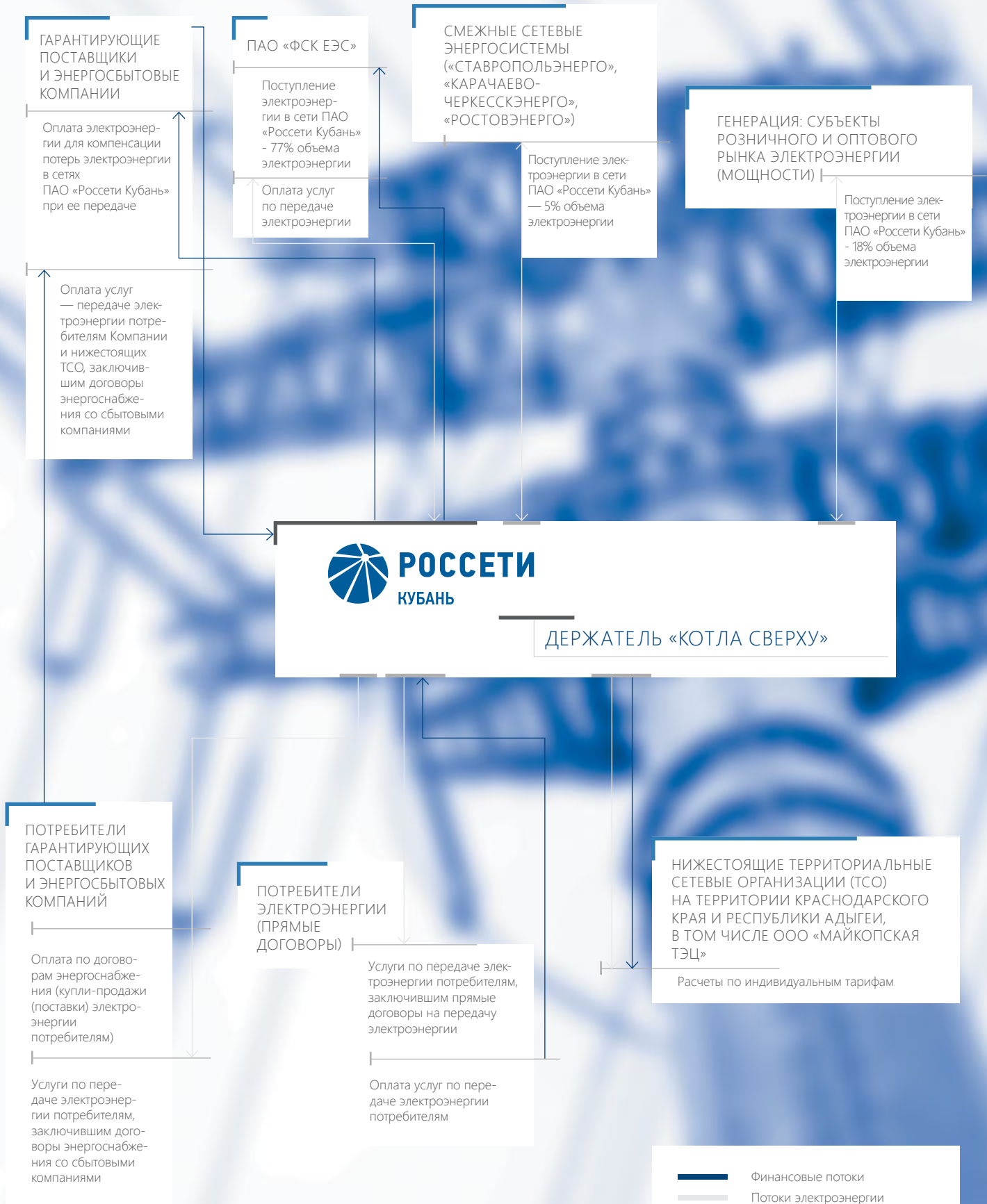
Схема операционных потоков Компании